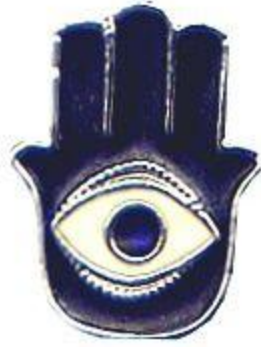
نمونه دیگر خمسای یهودی

نمونه ای از این طلسم که از یهودیت در ادیان ابراهیمی گسترش یافته را اینجا برای شما به نمایش در آورده ام. این طلسم در زبان عبری "خمسا" نام دارد که به شکل یک دست است و معمولاً رنگ لاجوردی دارد.