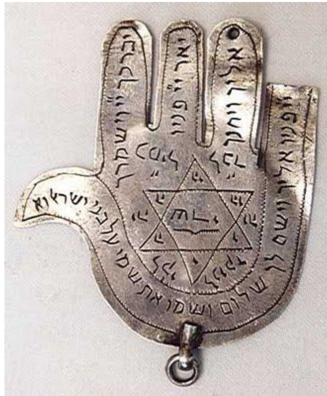
خمسه یا خمسا نمونه یهودی آن، به دعا نویسی و شکل نماد توجه کنید

نمونه ای از این طلسم که از یهودیت در ادیان ابراهیمی گسترش یافته را اینجا برای شما به نمایش در آورده ام. این طلسم در زبان عبری "خمسا" نام دارد که به شکل یک دست است و معمولاً رنگ لاجوردی دارد.