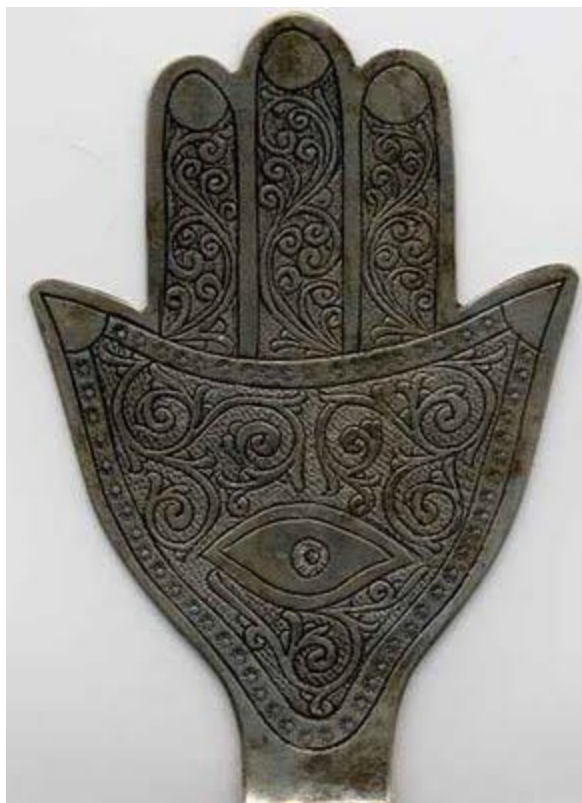
نمونه دیگر از پالم هندی