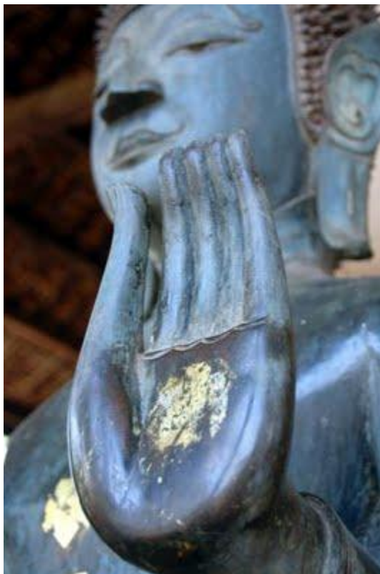
نمونه بودایی "خمسه"، "کف دست" یا "پالم" به شکل مشترک و وجود چشم در میان دست در تمام نمونه های خمسه